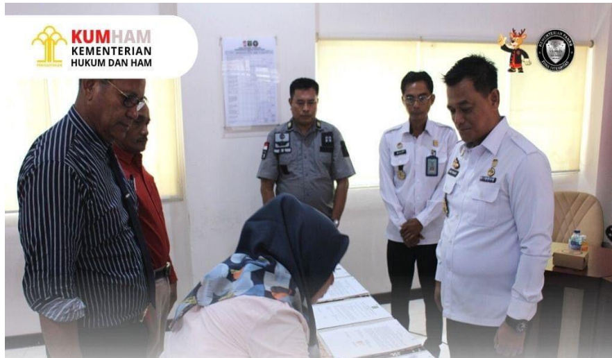
Gambar 3. Penandatanganan Perjanjian Pelaksanaan Bantuan Hukum oleh Organisasi Bantuan Hukum yang telah terakreditasi

Jl. Majapahit No. 44 Mataram, Telepon: (0370) 7856244 Laman: ntb.kemenkumham.go.id , Surel: kanwilntb@kemenkumham.go.id