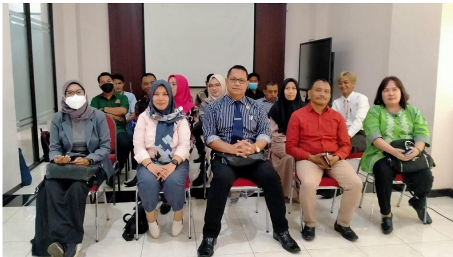
Gambar 2. Direktur/Ketua Pemberi Bantuan Hukum Terakreditasi dengan Kementerian di Wilayah Provinsi Nusa Tenggara Barat