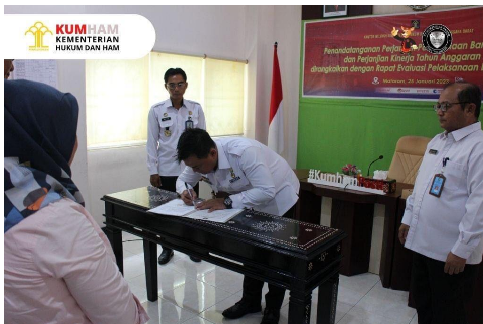
Gambar 4. Penandatanganan Perjanjian Kinerja Pelaksanaan Bantuan Hukum oleh Kepala Kantor Wilayah Kemenkumham NTB