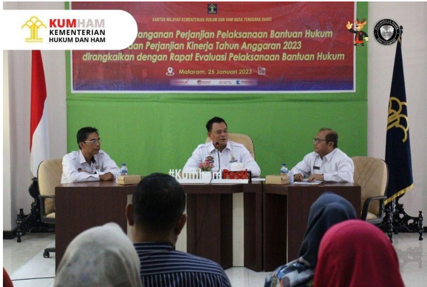
Gambar 1. Sambutan Kepala Kantor Wilayah Kemenkumham NTB